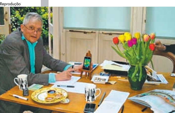
Hockney, um dos papas da pop art.

A singela pintura digital de David Hockney foi um dos desenhos expostos recentemente em Paris.